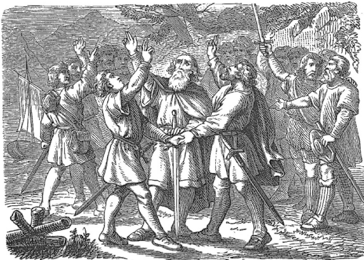
Der Schwur im Rütli.